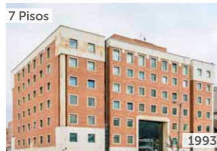
EDIFICIO HORIZONTE HEALTH RESOURCES Área total construida: 6.500 m 2 Avenida Calle 127 No. 20-78 NSE: 5 Unidades de consultorios: 250