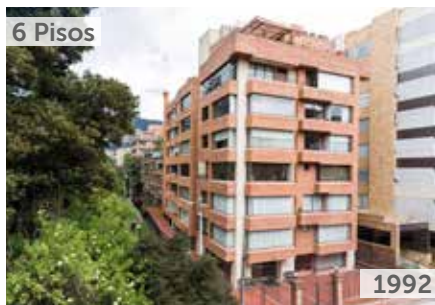
EDIFICIO GOLF COUNTRY Área total construida: 4.801 m 2 Transversal 14 No. 128A-98 NSE: 6 Unidades de vivienda: 15