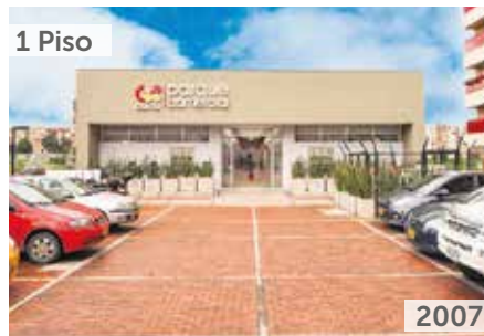
COLINA PARQUE COMERCIAL Área total construida: 1.600 m 2 Calle 153 No. 56-90 Unidades de locales: 59