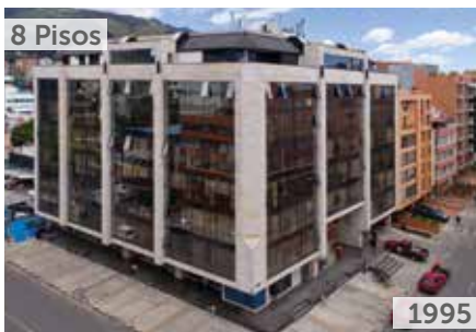
EDIFICIO OFICENTER 96 Área total construida: 7.000 m 2 Carrera 16 No. 96-64 NSE: 5 Unidades de oficina: 120