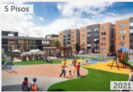
5 Pisos ACANTO 2 Área total construida: 61.227 m 2 Carrera 11 con Calle 8, Mosquera NSE: 3 Unidades de vivienda: 1.000