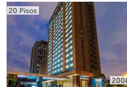
HOTEL AR Área total construida: 16.473 m 2 Carrera 62 No. 21-99 Número de habitaciones: 199