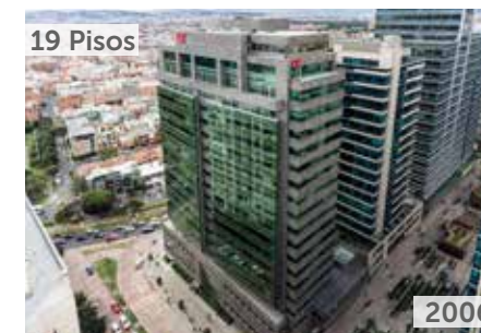
TORRE AR CENTRO EMPRESARIAL Área total construida: 21.482 m 2 Calle 113 No. 7-80 NSE: 6