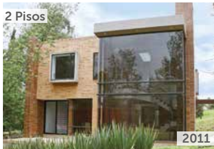
TORRELADERA BOSQUE RESERVADO CASAS 1 Área total construida: 7.559 m 2 Carrera 80 No. 151-31 NSE: 6 Unidades de vivienda: 28