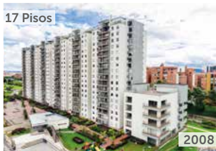
PARQUE CENTRAL CIUDAD SALITRE Área total construida: 56.551 m 2 Carrera 63 No. 22-45 NSE: 4 Unidades de vivienda: 408