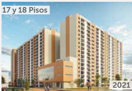
17 y 18 Pisos TORRES DE FONTIBÓN Área total construida: 63.365 m 2 Carrera 113 No. 20B - 15 NSE: 3 Unidades de vivienda: 1.120