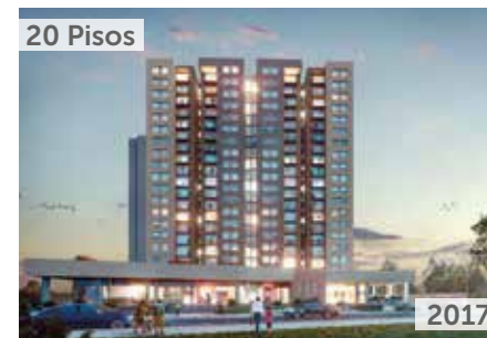
20 Pisos PARQUE CENTRAL DE OCCIDENTE 3 Área total construida: 73.150 m 2 Carrera 114 No. 78D-14 NSE: 4 Unidades de vivienda: 710