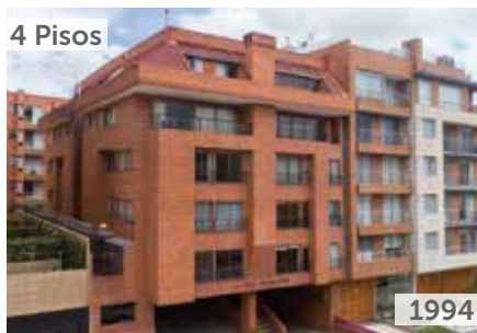
EDIFICIO SANTA BÁRBARA REAL Área total construida: 2.600 m 2 Carrera 17 No. 122-81 NSE: 6 Unidades de vivienda: 16