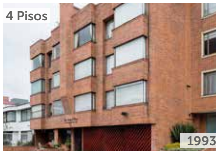
EDIFICIO SANTA BEATRIZ DEL PARQUE Área total construida: 2.500 m 2 Calle 121 No. 15A-43 NSE: 6 Unidades de vivienda: 12