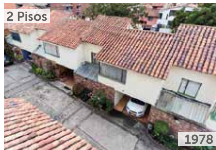
CONJUNTO RESIDENCIAL LOS PRADOS Área total construida: 2.000 m 2 Carrera 13 No. 142-85 NSE: 4 Unidades de vivienda: 8