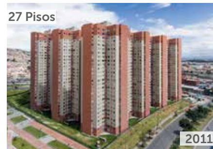
PARQUE CENTRAL BONAVISTA 2 Área total construida: 97.002 m 2 Calle 68 No. 70D-71 Sur NSE: 3 Unidades de vivienda: 1.296