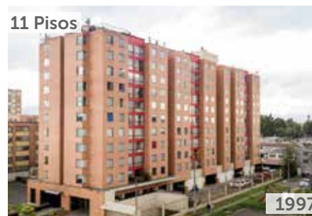
PARQUES DE NORMANDÍA Área total construida: 16.740 m 2 Calle 59A No. 75A-31 NSE: 4 Unidades de vivienda: 211