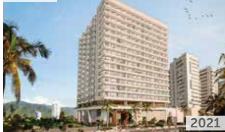
RESERVA DEL MAR BELLO HORIZONTE Área total construida: 29.100 m 2 Carrera 2 No. 113 - 363 NSE: 6 Unidades de vivienda: 310