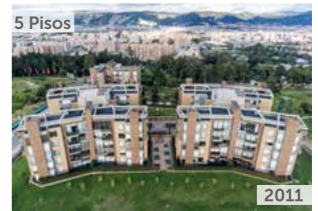
TORRELADERA BOSQUE RESERVADO APTOS. TORRE 1 Y 2 Área total construida: 12.519 m 2 Carrera 80 No. 150-31 NSE: 6 Unidades de vivienda: 40