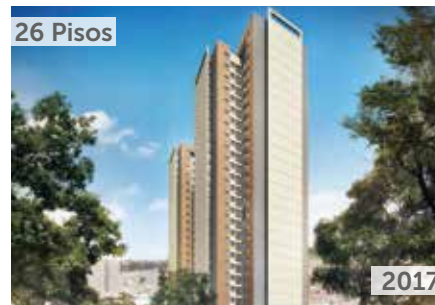
CERROS DE SUBA Área total construida: 23.780 m 2 Avenida Carrera 91 No. 128A-90 NSE: 2 Unidades de vivienda: 404