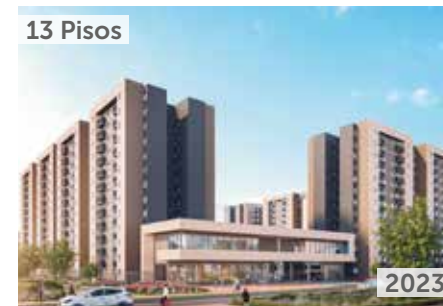
13 Pisos FONTANA 7 Área total construida: 56.243 m 2 Calle 7 No. 25-95, Madrid NSE: 4 Unidades de vivienda: 816