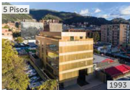
EDIFICIO OFICENTER 93 Área total construida: 3.500 m 2 Carrera 14 No. 93A-30 NSE: 6 Unidades de oficina: 40