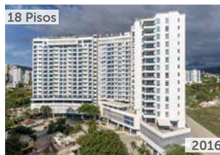
RESERVA DEL MAR TORRE 3 Área total construida: 23.432 m 2 Calle 22 No. 1-67, Santa Marta NSE: 6 Unidades de vivienda: 141