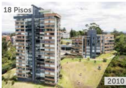
RESERVA DE LOS LAGOS Área total construida: 12.287 m 2 Carrera 72B No. 121-80 NSE: 6 Unidades de vivienda: 41