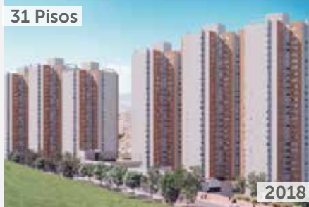
31 Pisos TORRES DEL 20 DE JULIO Área total construida: 97.246 m 2 Carrera 10 No. 28-68 Sur NSE: 3 Unidades de vivienda: 1.450