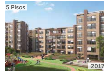
TORRELADERA BOSQUE RESERVADO APTOS. TORRE 4 Área total construida: 6.331 m 2 Carrera 80 No. 150-31 NSE: 6 Unidades de vivienda: 20