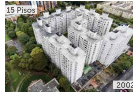
RINCÓN DEL PARQUE Área total construida: 59.125 m 2 Carrera 14B No. 161-54 NSE: 4 Unidades de vivienda: 705