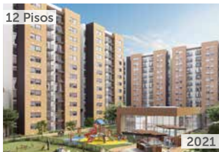
12 Pisos SALINAS 2 CIUDADELA CAMPESTRE Área total construida: 63.803 m 2 Calle 8 con transversal 22, Zipaquirá NSE: 2 Unidades de vivienda: 960