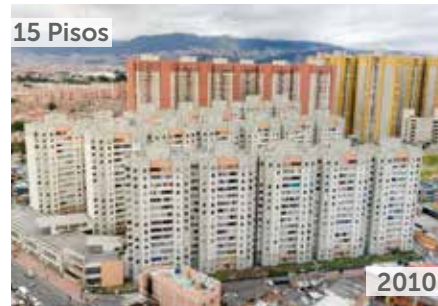
PARQUE CENTRAL BONAVISTA 1 Área total construida: 67.054 m 2 Transversal 70G No. 63-52 Sur NSE: 3 Unidades de vivienda: 1.080