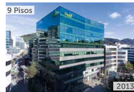
TORRE EAR - OFICINAS Y LOCALES Área total construida: 11.400 m 2 Calle 99 No. 14-49 NSE: 5