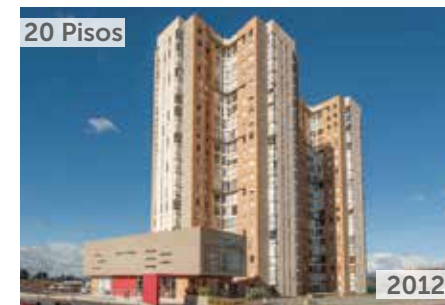
CIUDADELA PARQUE CENTRAL DE OCCIDENTE 2 Área total construida: 60.370 m 2 Calle 77B No. 129-70 NSE: 4 Unidades de vivienda: 640