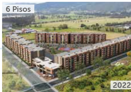
6 Pisos LA RESERVA DE SOPÓ 2 Área total construida: 32.600 m 2 Transversal 7 No. 6-119 NSE: 3 Unidades de vivienda: 468