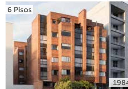
EDIFICIO MIGUELINES Área total construida: 5.000 m 2 Calle 116 No. 9-82 NSE: 6 Unidades de vivienda: 40