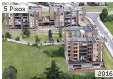
TORRELADERA BOSQUE RESERVADO APTOS. TORRE 3 Área total construida: 6.506 m 2 Carrera 80 No. 151-31 NSE: 6 Unidades de vivienda: 20