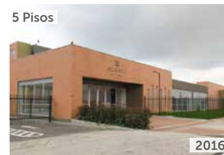
ACANTO RESERVA DE MOSQUERA Área total construida: 31.910 m 2 Carrera 11 con calle 8 NSE: 3 Unidades de vivienda: 560