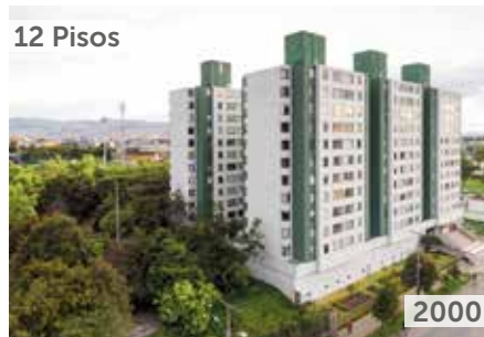
AVENTURA PLAZA Área total construida: 17.999 m 2 Diagonal 3 No. 71B-29 NSE: 3 Unidades de vivienda: 264