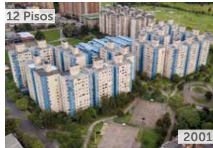
PARQUE CENTRAL SALITRE ETAPAS 1, 2, 3 Y 4 Área total construida: 161.998 m 2 Carrera 54 No. 64A-45/75 NSE: 4 Unidades de vivienda: 2.304