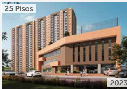
25 Pisos TORRES DE YOMASA Área total construida: 30.619 m 2 Carrera 1 No. 85 - 10 sur NSE: 2 Unidades de vivienda: 500