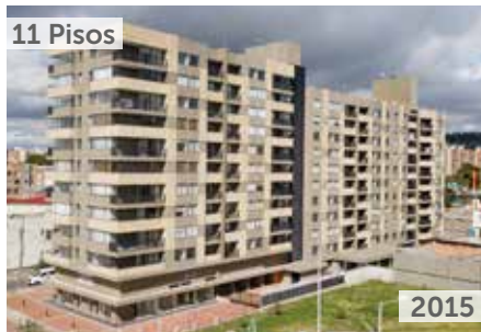
PARK 170 Área total construida: 17.014 m 2 Calle 167A No. 55A-60 NSE: 3 Unidades de vivienda: 124