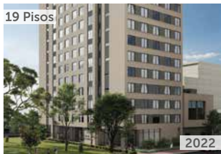
19 Pisos TORRE DE LOS ANDES Área total construida: 13.711 m 2 Carrera 61 No. 103-15 NSE: 4 Unidades de vivienda: 336