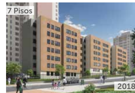
BONAVISTA 3 Área total construida: 4.207 m 2 Transversal 70D No. 64-10 Sur NSE: 3 Unidades de vivienda: 70