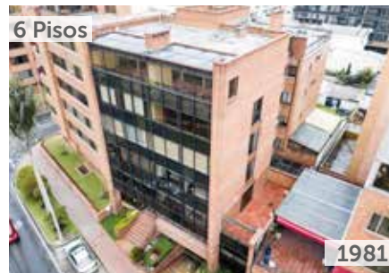
EDIFICIO OLIVARES Área total construida: 3.500 m 2 Calle 116 No. 13A-06 NSE: 6 Unidades de vivienda: 18