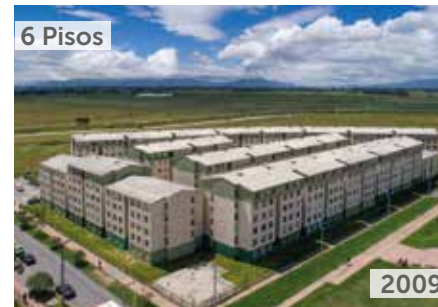
ALAMEDA EL PORVENIR Área total construida: 52.731 m 2 Calle 55 Sur No. 104-48 NSE: 2 Unidades de vivienda: 960