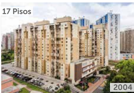
PARQUE CENTRAL PONTEVEDRA ETAPAS 1, 2 Y 3 Área total construida: 163.115 m 2 Avenida Boyacá No. 83-50 NSE: 4 Unidades de vivienda: 1.221