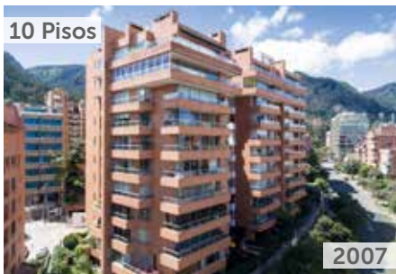
ROSALES RESERVADO Área total construida: 46.982 m 2 Carrera 2 No. 76A-02 NSE: 6 Unidades de vivienda: 80