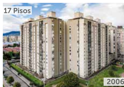
PARQUE CENTRAL COLINA ETAPAS 1 Y 2 Área total construida: 138.706 m 2 Calle 153 No. 55-80 NSE: 4 Unidades de vivienda: 1.632