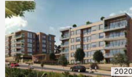
TORRELADERA BOSQUE RESERVADO APTOS. ETAPA 2 Área total construida: 19.200 m 2 Carrera 80 No. 150-31 NSE: 6 Unidades de vivienda: 66