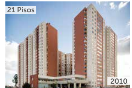
CIUDADELA PARQUE CENTRAL DE OCCIDENTE 1 Área total construida: 75.954 m 2 Calle 77B No. 129-11 NSE: 3 Unidades de vivienda: 756