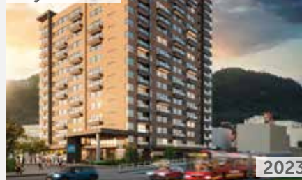
RESERVA DE LA 26 Área total construida: 23.756 m 2 Calle 37 No. 29 - 01 NSE: 4 Unidades de vivienda: 481