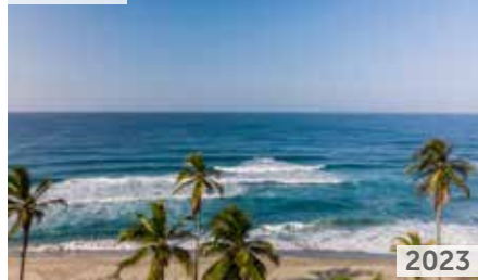
RESERVA DEL MAR BELLO HORIZONTE 2 Área total construida: 53.000 m 2 Carrera 2 No. 114 - 03 NSE: 6 Unidades de vivienda: 672