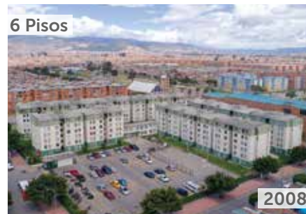
ALAMEDA EL RECREO Área total construida: 17.757 m 2 Calle 69 Sur No. 95A-41 NSE: 2 Unidades de Vivienda: 312