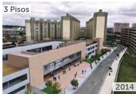
COLEGIO DISTRITAL AGUDELO RESTREPO Área total construida: 10.560 m 2 Calle 68 Sur No. 70D-71 y Transversal 70G No. 63-52 NSE: 2