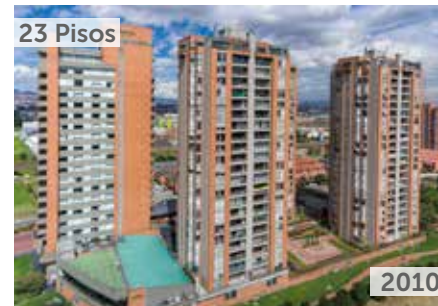
ARBOLEDA DEL SALITRE Área total construida: 52.181 m 2 Carrera 62 No. 21-99 NSE: 5 Unidades de vivienda: 258