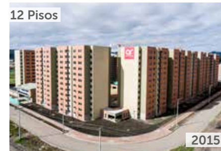
FONTANA Área total construida: 54.183 m 2 Calle 6 Sur No. 23-187, Madrid NSE: 2 Unidades de vivienda: 768