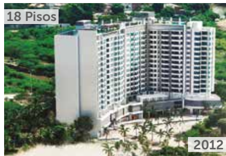
RESERVA DEL MAR TORRES 1 Y 2 Área total construida: 34.036 m 2 Calle 22 No. 1-67 Santa Marta NSE: 6 Unidades de vivienda: 195