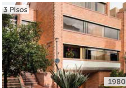
EDIFICIO CHAMBERY Área total construida: 1.500 m 2 Carrera 13A No. 113-80 NSE: 6 Unidades de vivienda: 5