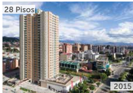
TORRE IMPERIAL Área total construida: 28.549 m 2 Carrera 103B No. 153-85 NSE: 3 Unidades de vivienda: 241