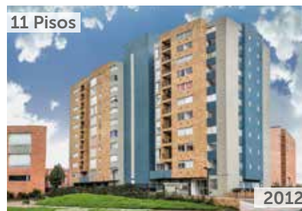
BALCONES DEL ÁLAMO Área total construida: 7.203 m 2 Calle 72A No. 87-39 NSE: 3 Unidades de vivienda: 70