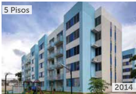
ALCÁZAR DE IVESUR Área total construida: 11.890 m 2 Av. Circunvalar cra 28 No. 54-45 NSE: 2 Unidades de vivienda: 200