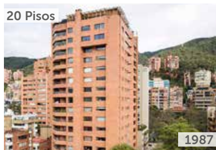
TORRE DE LA CABRERA Área total construida: 20.000 m 2 Carrera 9 No. 85-32 NSE: 6 Unidades de vivienda: 36