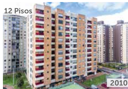
RESERVA DE COLINA Área total construida: 7.814 m 2 Carrera 56 No. 153-15 NSE: 4 Unidades de vivienda: 55