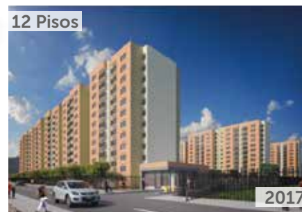
FONTANA 2 Área total construida: 76.378 m 2 Calle 7 No. 25-95, Madrid NSE: 2 Unidades de vivienda: 1.056