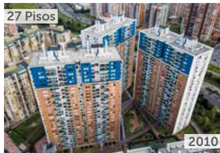
GRAN RESERVA DE PONTEVEDRA Área total construida: 95.427 m 2 Calle 95 No. 71-75 NSE: 4 Unidades de vivienda: 648