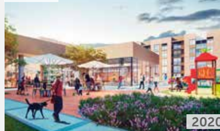
RESERVA DE CAJICÁ Área total construida: 47.532 m 2 Carrera 6, Camino del Centello NSE: 4 Unidades de vivienda: 760