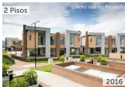
TORRELADERA BOSQUE RESERVADO CASAS 3 Área total construida: 6.374 m 2 Carrera 80 No. 151-31 NSE: 6 Unidades de vivienda: 30