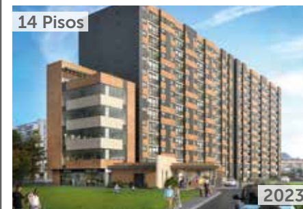
14 Pisos RESERVA DE CHÍA Área total construida: 18.825 m 2 Av. Pradilla No. 4 - 45 Este NSE: 4 Unidades de vivienda: 500