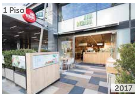
ANA REBANA Área total construida: 120 m 2 Torre EAR, Calle 99 No. 14-49