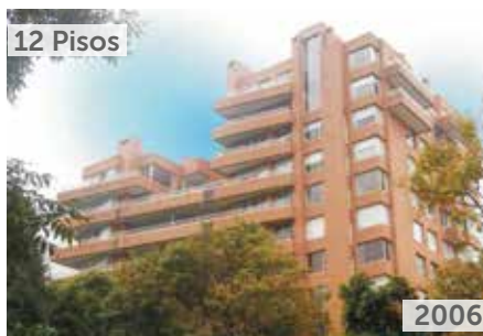
CABRERA RESERVADO Área total construida: 17.461 m 2 Carrera 12 No. 86-53/69 NSE: 6 Unidades de vivienda: 40