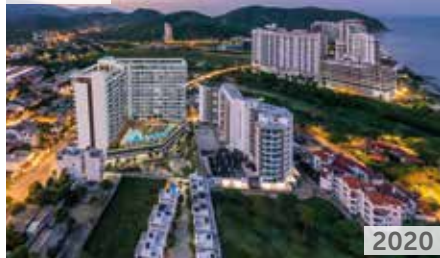
RESERVA DEL MAR II Área total construida: 19.000 m 2 Av. Tamacá con calle 21 NSE: 5 Unidades de vivienda: 436