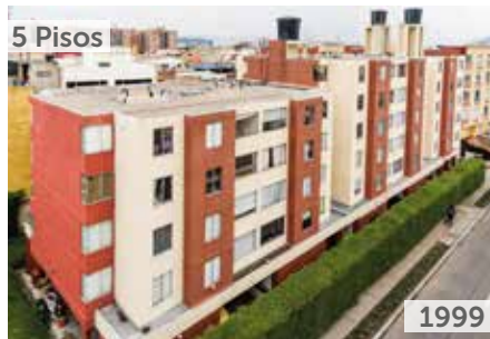
CEDRO 153 Área total construida: 3.179 m 2 Carrera 7F No. 153-45 NSE: 3 Unidades de vivienda: 50